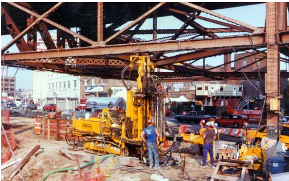
Fig. 4. Sonda P 1000 con mast corto e caricatore automatico.

I lavori di attraversamento dei tunnels della metropolitana sono stati eseguiti durante la notte dei fine settimana, garantendo così il regolare funzionamento delle linee du-