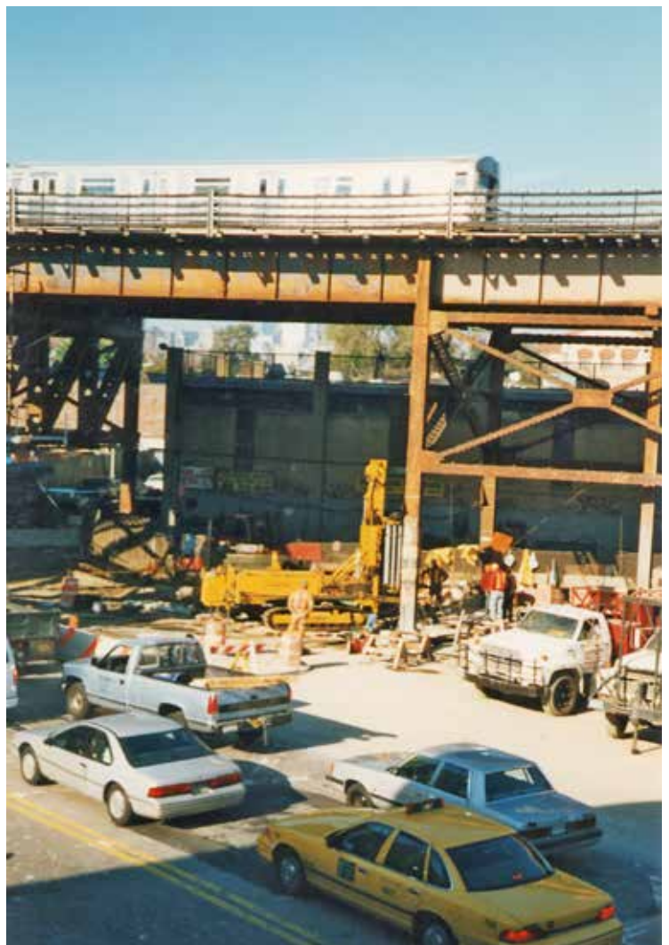
Fig. 3. Sonda P 1000

Si richiedeva inoltre particolare attenzione circa la pulizia delle