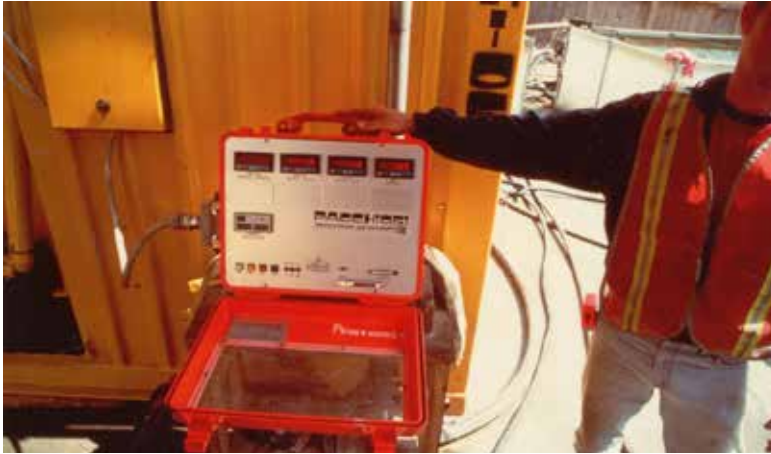
Fig. 8. Sistema d'acquisizione dati PRS3.