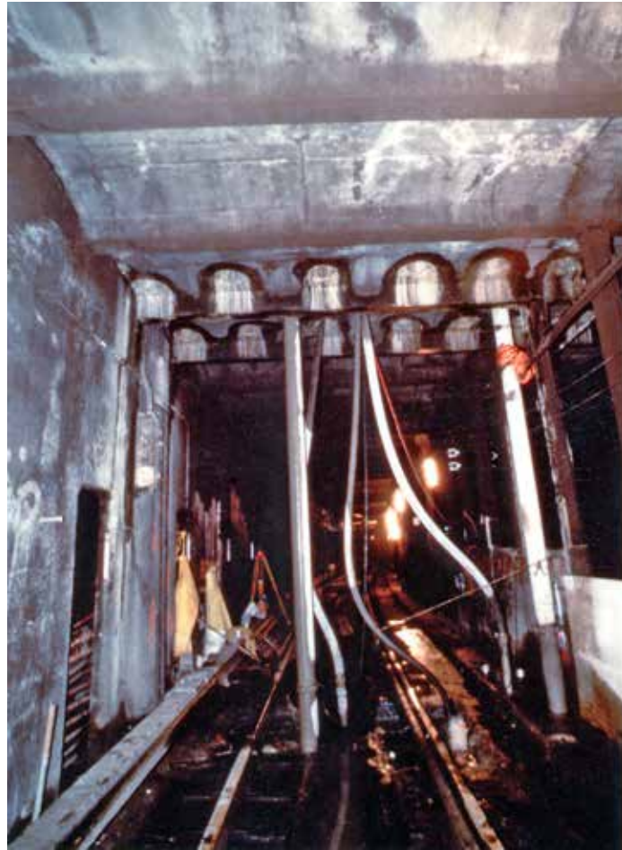
Fig. 5. Fasi di lavoro al muro C.