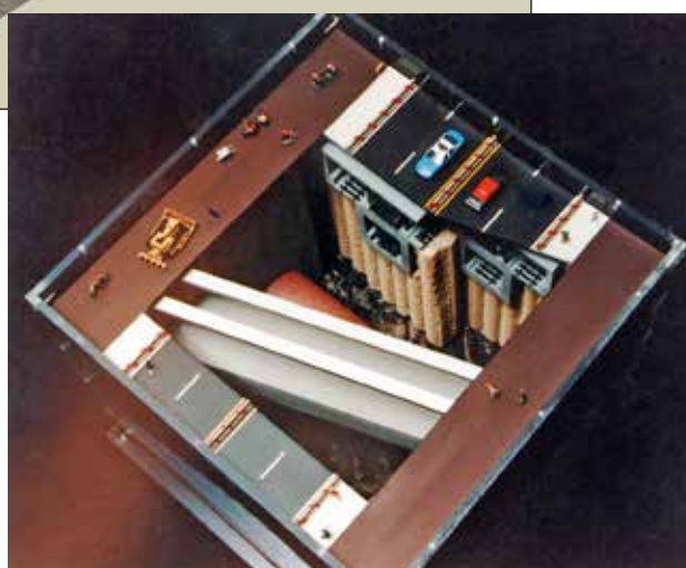
Fig. 1. Rappresentazione 3D dell'area d'intervento con vista della sezione e plastico con vista dal piano campagna.