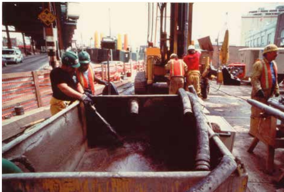
Fig. 6. Vasca di raccolta dei reflui.