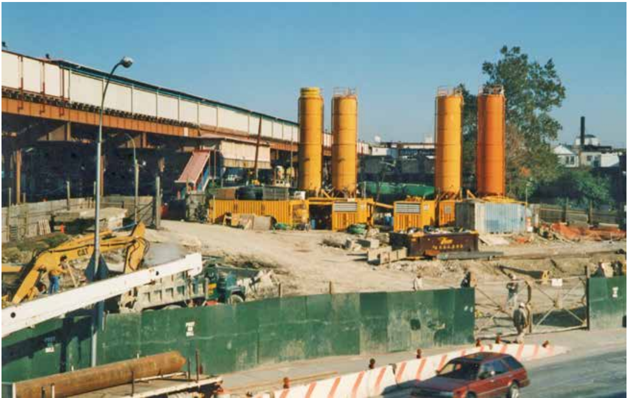
Fig. 12. Vista del cantiere.