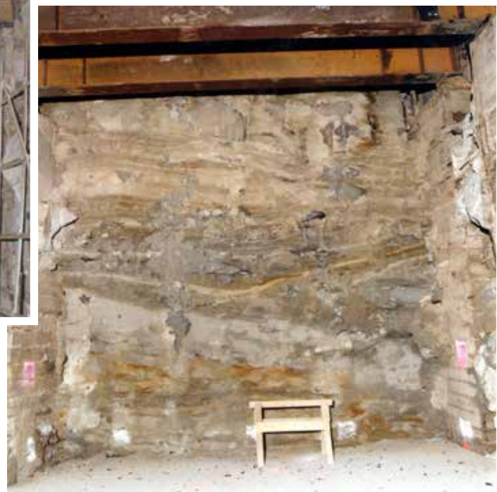
Fig. 11. Verifiche sul Jet-Grouting nella zona interna tra i muri A e B.