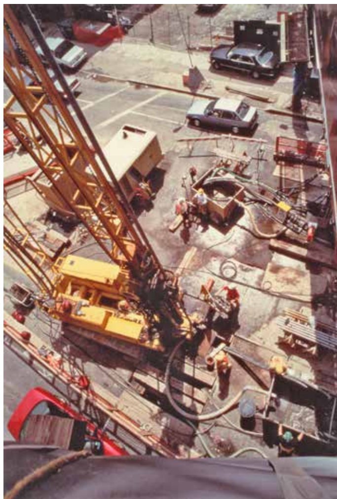
Fig. 13. Sonda P 1500 ES durante la lavorazione.