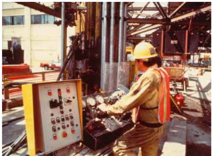
Fig. 9. Sonda P 1000 impegnata durante le fasi di Jet-Grouting.