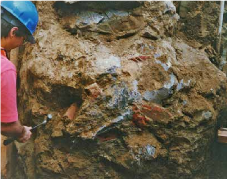
Fig. 10. Verifiche sul Jet-Grouting.

Lo scavo ha evidenziato colonne con diametro tra 150 e 200 cm e spessore del muro compreso tra 200 e 250 cm.