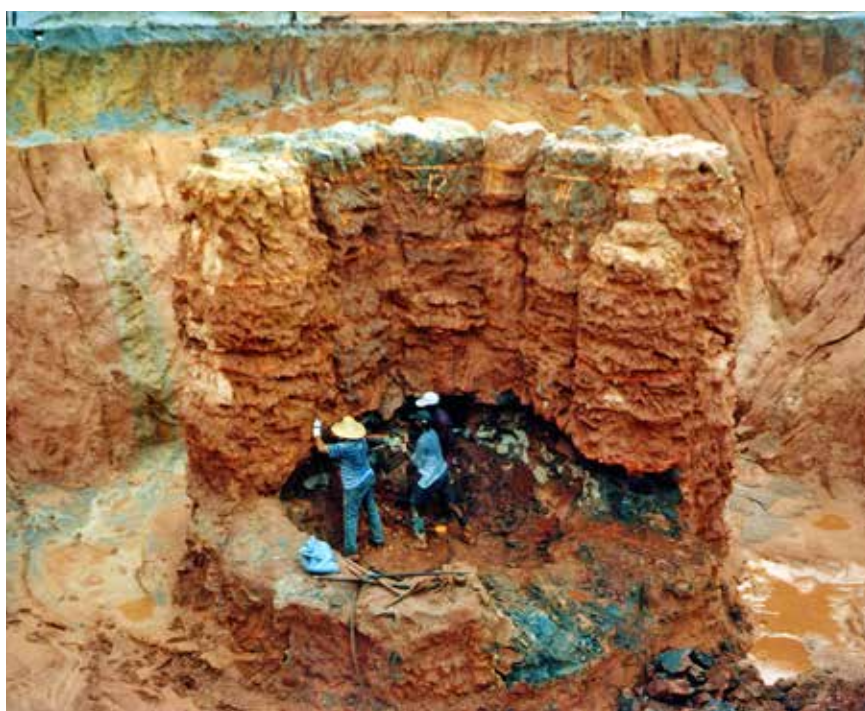
Fig. 8. Scavo delle colonne del campo prova.

tuate delle prove di permeabilità del tipo Lefranc e Lugeon, che hanno fornito valori di K < 2 \times 10^{-7} m/sec. All'interno del campo prove è stato realizzato un pozzo, per eseguire una prova di emungimento della durata di 24 ore (Fig. 6). Durante una prima fase di pompaggio sono state effettuate misurazioni di abbassamento del livello della falda interna al pozzo; simultaneamente la medesima verifica veniva eseguita su due piezometri esterni. Le stesse misurazioni ripetute durante il ripristino naturale di livello della falda (successive 24 ore) hanno fornito un valore di permeabilità dello schermo pari a K < 2 \times 10^{-7} m/sec. Le colonne sono state poi scavate (Fig. 7-8), riscontrando che le dimensioni variavano da un diametro minimo di 135 ad uno massimo di 180 cm, a seconda dei