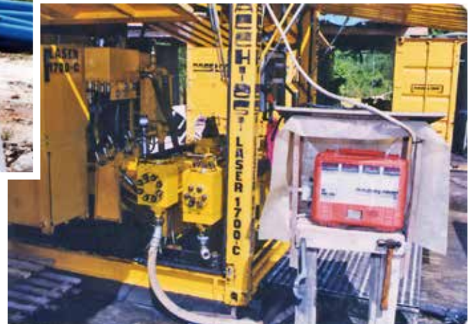
Fig. 14 - 15. Sistema di registrazione PRS3 .