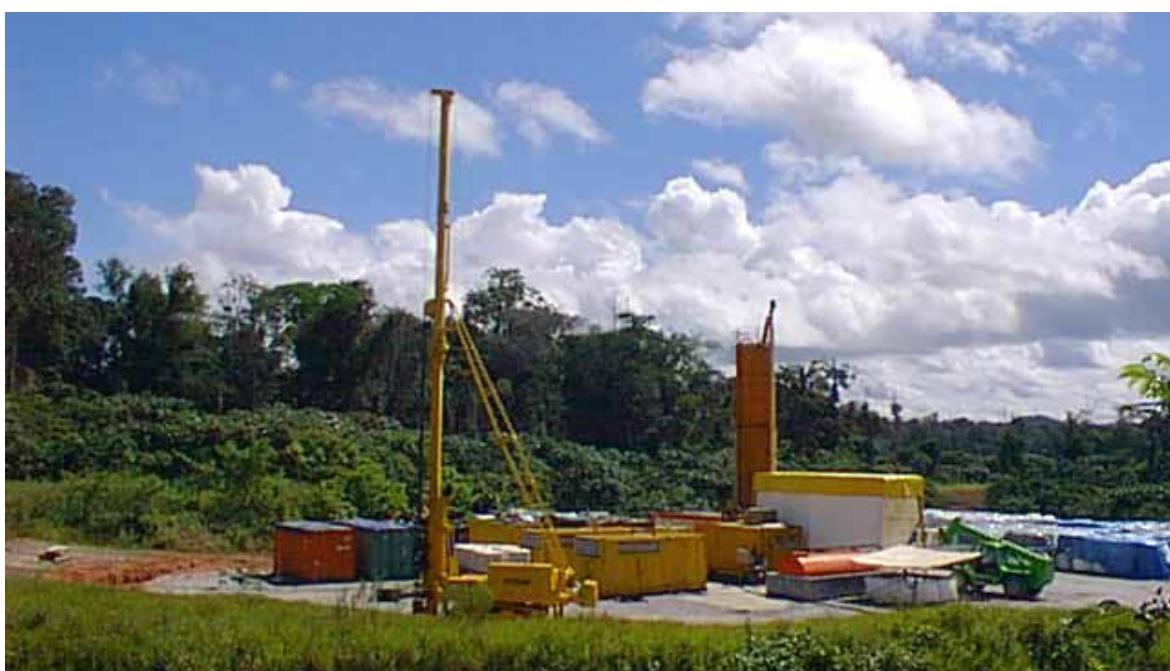
Fig. 17. Vista del sistema di pompaggio.