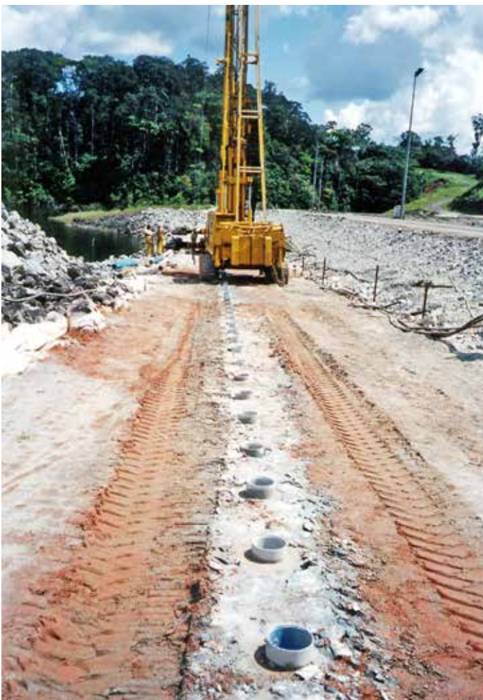
Fig.10. Fila di colonne.