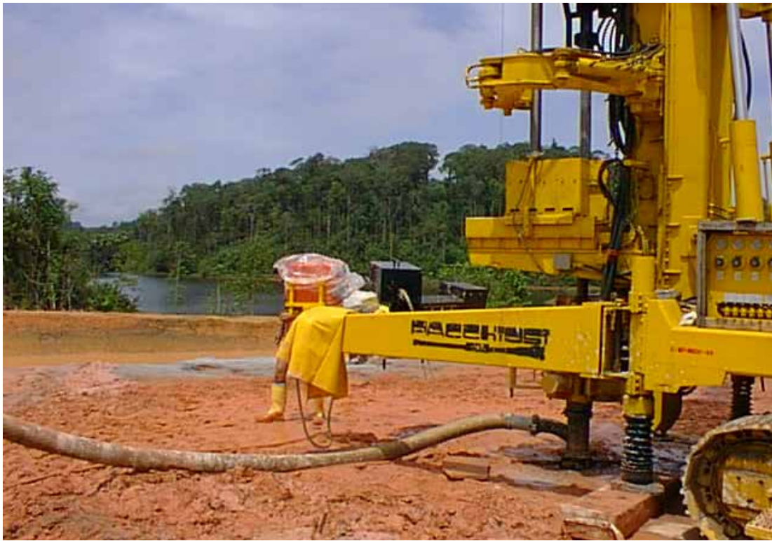
Fig. 13. Recupero reflui.

zioni di boiaccia, eliminando così il rischio di interferenza sul sistema drenante e di monitoraggio delle dighe. Inoltre, per evitare che in superficie i reflui di perforazione e di iniezione inquinassero le acque del bacino idroelettrico, un dispositivo posizionato sulla testa dei tubi in pvc intercettava i fluidi e li convogliava in una zona di raccolta, lontano dalle acque dell'invaso (Fig. 13).