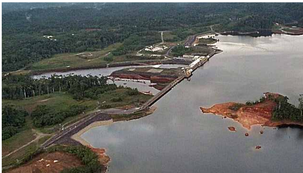
Fig. 1. Veduta aerea della diga del Petit Saut e, sotto, vista delle sonde sul campo.