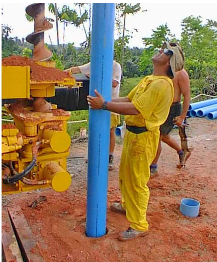
Fig. 12. Posa di tubo in PVC.