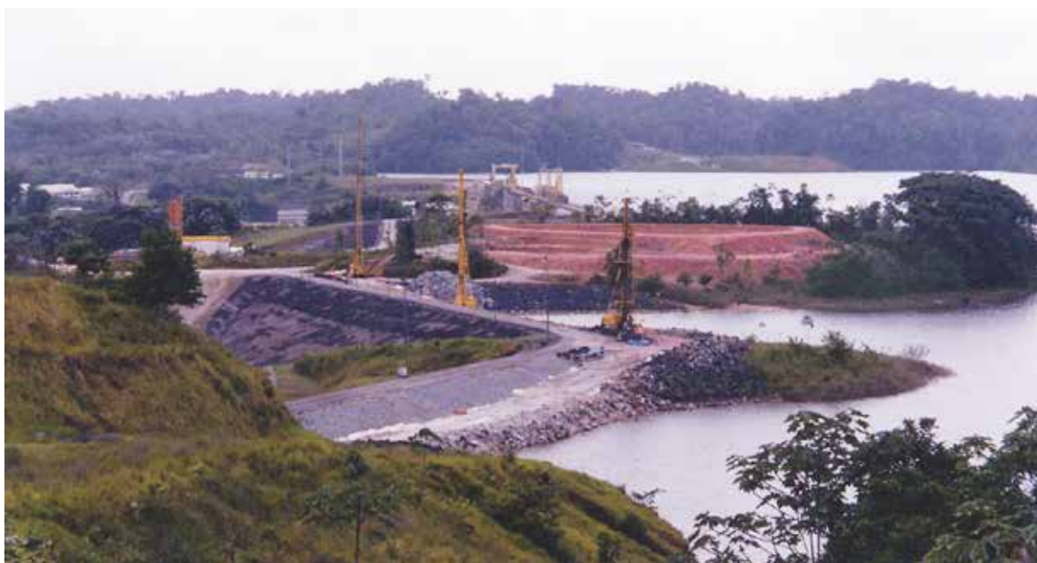
Fig. 16. Sonde al lavoro sulla diga.

Lo schermo, realizzato con il Pacchiosi System PS3, è stato infine integrato con delle iniezioni di tipo tradizionale nel substrato granitico.