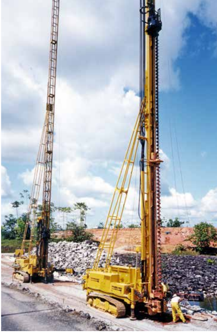
Fig. 5. Sonde P 1500 ECS ed ES per carotaggi.

Dopo la maturazione delle colonne, sono stati eseguiti 16 fori di controllo nelle zone di sovrapposizione tra colonne adiacenti, di cui 8 a distruzione di nucleo e 8 a carotaggio continuo (Fig. 5), che hanno permesso di verificare la qualità delle colonne. Su tutti i fori di controllo sono state effet-