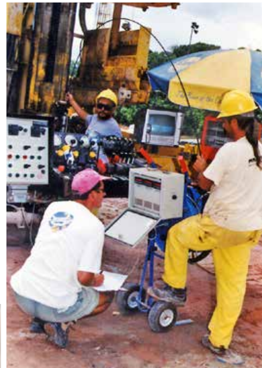
Fig. 4. Sonda P 1500 ECS per Jet Grouting.