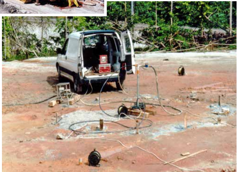
Fig. 6. Prova di emungimento con misure del livello di falda.